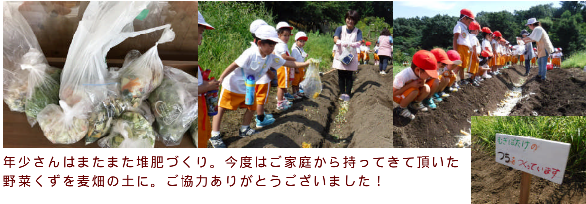
年少さんはまたまた堆肥づくり。今度はご家庭から持ってきて頂いた野菜くずを麦畑の土に。ご協力ありがとうございました！