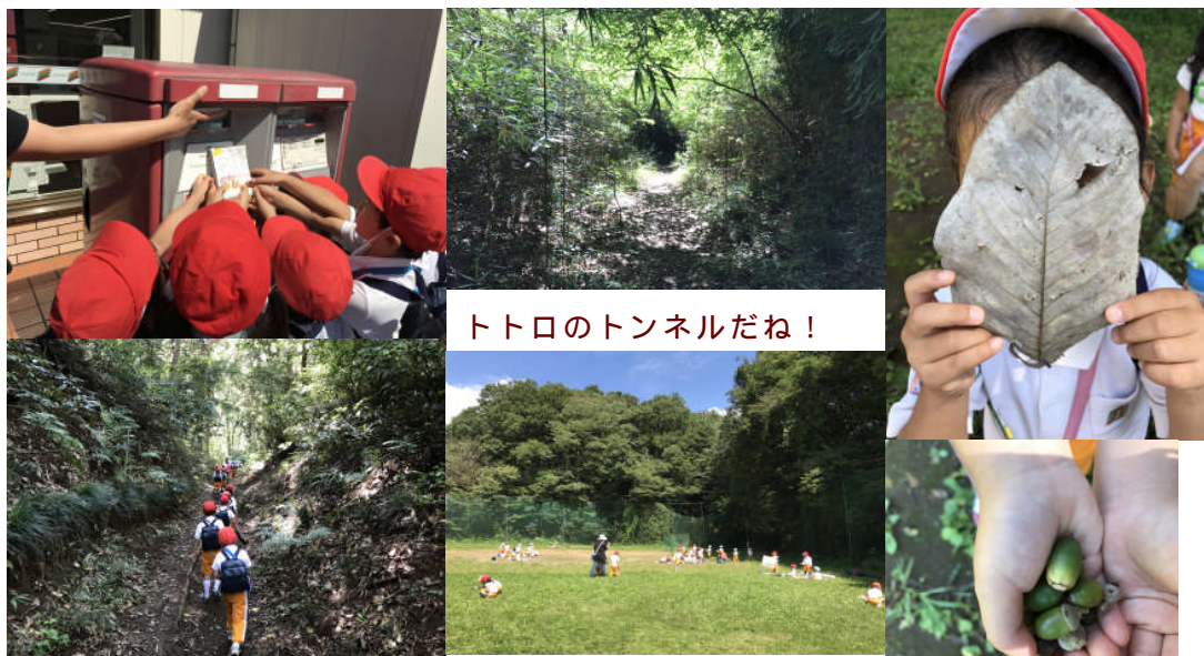
年中さんは敬老の日のハガキを郵便ポストに投函しに出掛け、帰りは森を歩いてジャグランドへ。お弁当を多べて帰ってきました！