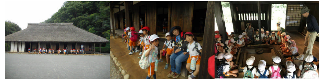
年長は上大島の古民家見学。「土の床だね！これがいるりか！」館長さんに説明頂いた。