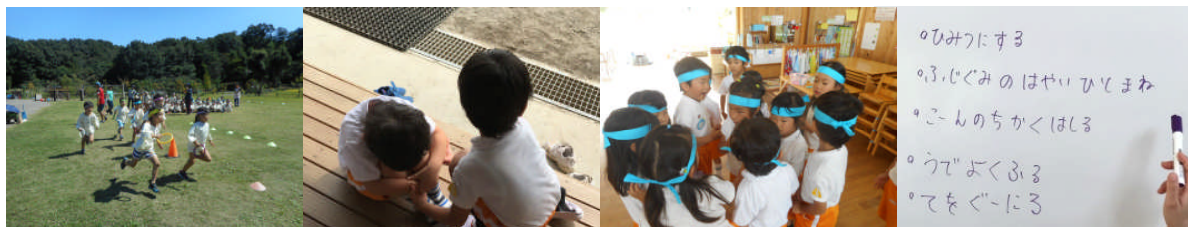
色々なドラマが見られるリレー。悔し涙、友の励まし、反省会、戦略を練って、、、

子どもたちの頑張りを認め、成長を称える素敵な会となりますよう、どうぞ皆様のご理解とご協力をお願い申し上げます。