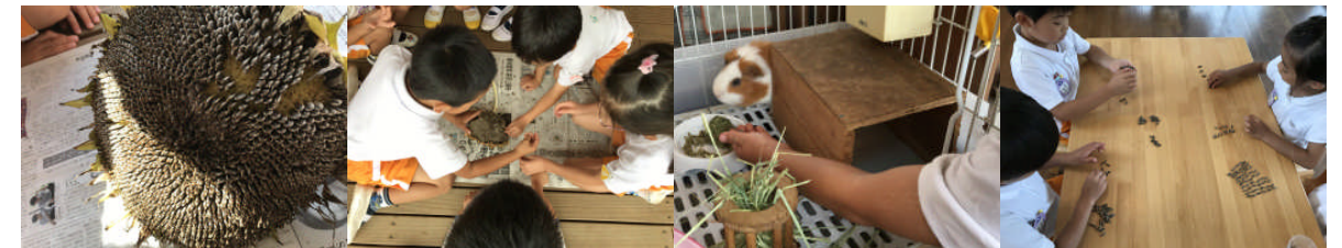
ヒマワリの種を取りました。そういえばモルモットは食べるかな？ 数を数えてみよう。