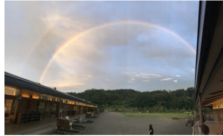
見事な虹が架かりました！