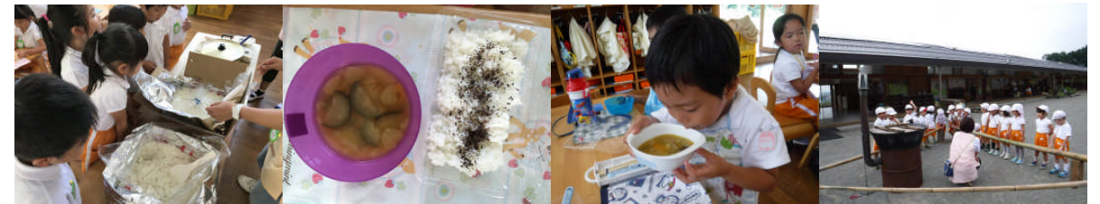
炊き出し会。化米と畑の野菜汁を頂きました。質素ですが、実際の災害を想定して、畑にあるカボチャ、ジャガイモ、タマネギ、ニンジン、ナス、などが入ったお味噌汁を作っていただきました。「足るを知る」経験にもなりました。