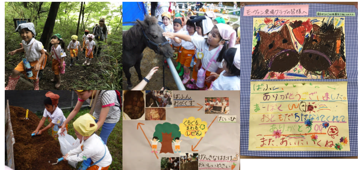
年少さん、森を抜け乗馬クラブへ。保育室前のテラスガーデンの堆肥にするため、馬糞を頂きました。保育室には循環図が貼ってあります。お礼に乗馬クラブのポニーさんに絵を描きました。