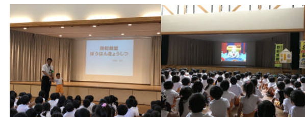
防犯教室・・・「いかのおすし」