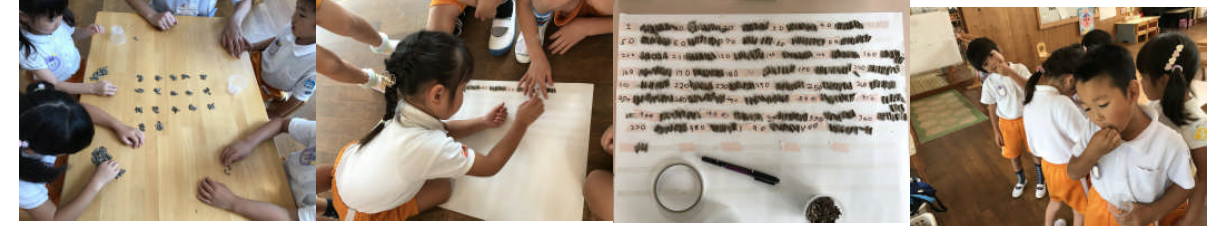
グループ毎に色々な数え方が見られました。皮を剥いて食べてみました。美味しい！