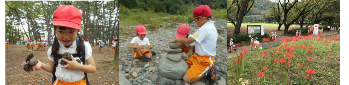
松林で松ぼっくり拾い。相模川では陶芸の型用の石探しと石積み遊び。