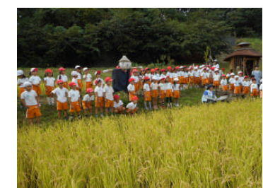
黄金色に頭を垂れ、いよいよ収穫です！