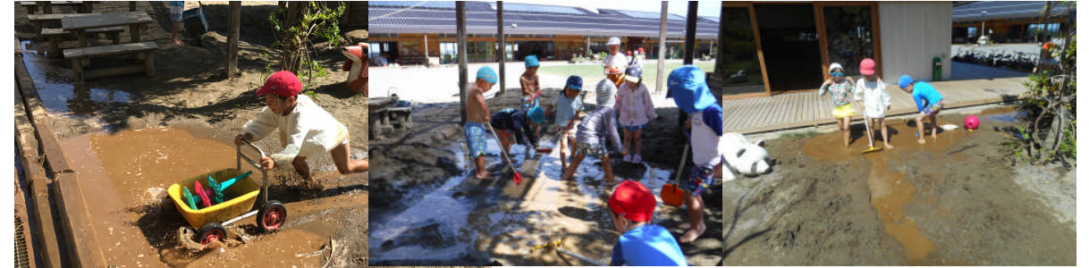
水あそび・・・暑い日にはまだ水遊びが盛んです。「パンツの替えならいくらでもある」と自作の歌を歌いながら、いい表情で遊んでいます。